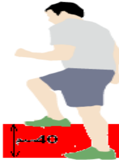
شكل: إختبار الخطوة لدقيقة step test "1"